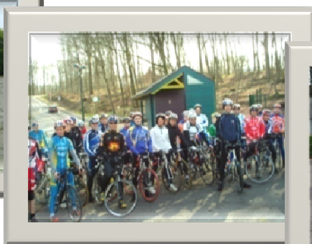
Cyclisme sur route